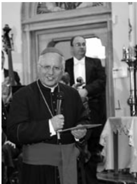
Ob koncu koncerta se škof zahvaljuje nastopajočim ter gostom.