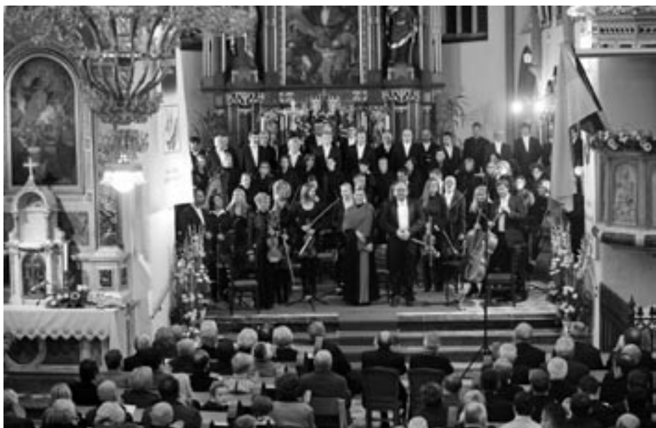
Mešani pevski zbor in Komorni orkester Glasbene matice Ljubljana s solisti