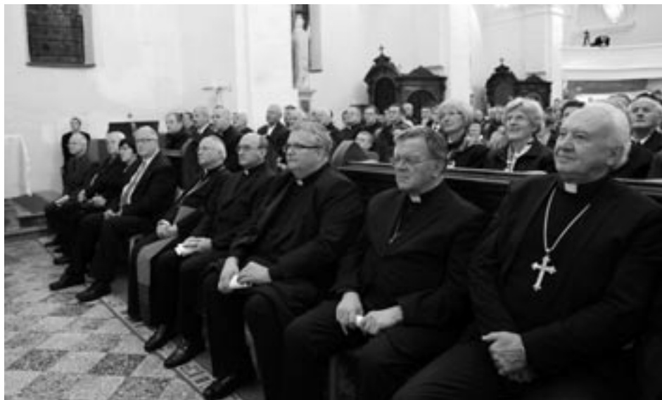
Visoki gostje na koncertu v stolnici sv. Nikolaja

za apostolskega administratorja ljubljanske nadškofije, škofje pa so ga izvolili še za predsednika Slovenske škofovske konference. Obe novi nalogi sta mu zelo povečali obseg dela. Za njegov delovnik to pomeni, da je poleg ponedeljka, ko se redno mudi na ljubljanski nadškofiji, v Ljubljani povprečno še dvakrat na teden, sodeluje na raznih sejah in sestankih ter sprejema duhovnike in druge goste. Dobro, da mu tako v Novem mestu kot v Ljubljani pri delu stojita ob strani ekipi na ordinariatu, ki na obeh krajih delujeta v polni zasedbi. Letos jeseni so bila poseben zalogaj tudi vprašanja glede odnosa med Cerkvijo in državo, ki so se odpirala ob novih zakonskih predlogih o obdavčitvi nepremičnin in idejah o spremembi zakona o verski svobodi. To breme v največji meri pade na vsakokratnega predsednika SŠK. V teh okoliščinah, ko je veliko odprtih